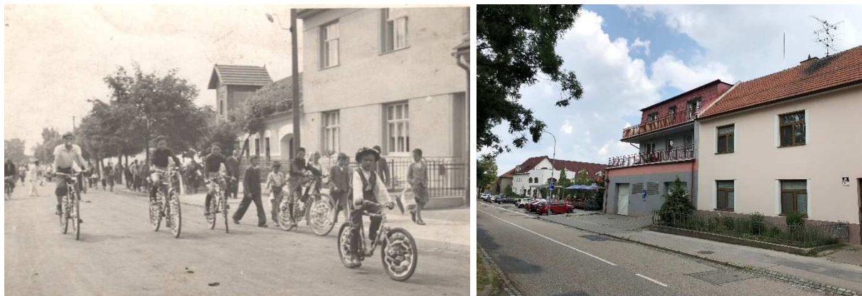
Průvod na Přemyslově náměstí koncem 30. let 20. stol. Stejný pohled v roce 2018

Nejstarší částí obce Slatina – Přemyslovu náměstí – jsme se v seriálu Slatina kdysi a dnes věnovali už vícekrát. V tomto porovnání se na Přemyslovo náměstí vracíme už po šesté. Tentokrát je na historickém snímku s průvodem, který byl pořízen koncem 30. let 20. století, zachycen původní dům s transformátorem umístěným na střeše. Toto stavení však později vyhořelo a dnes na stejném místě stojí obytný dům s několika byty, na který navazuje pošta.