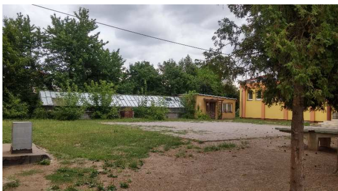
Skleník u základní školy v červenci 2015