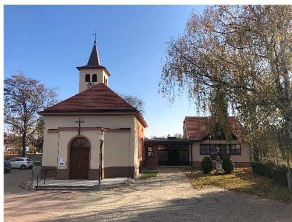
Slatinský kostel s oratoří v listopadu 2018