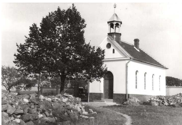
Původní hřbitovní kaple v roce 1943