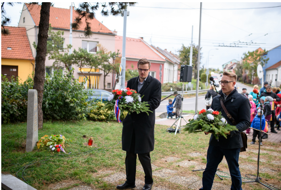
Vzpomínková akce na osvobození Slatiny