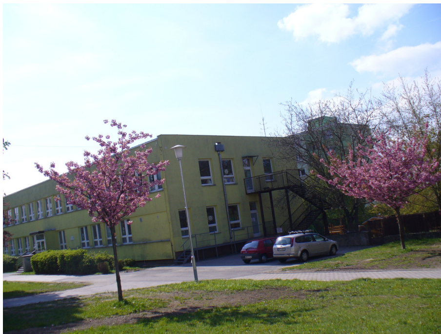
Pohled na budovu MŠ