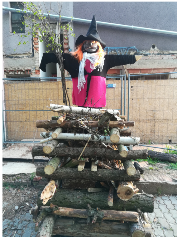
Pálení čarodějnic ve sportovním areálu SK Slatina