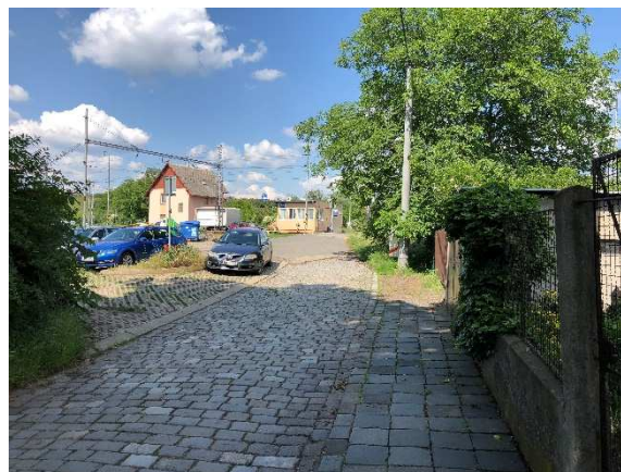
Stejný pohled v roce 2018

Slatinka byla původně osada na jihovýchodním okraji slatinského území. Byla vystavěna ve druhé třetině 18. století v polích mezi Slatinou a Tuřany kolem kostelíku a poutního místa, zvaného Stella Aurea – Zlatá nebo též Mariánská Hvězda. Po zrušení poutního kostelíku v roce 1874 a později i jeho zboření byla osada lidově nazývána Malá Slatina či Slatinka. V roce 1887 byla u severního konce Slatinky postavena Vlárská dráha. Ve druhé polovině 20. století pokračovala izolace osady od okolních sídel vybudováním tuřanského letiště jižně od Slatinky a severně stavbou průmyslových areálů kolem slatinského nádraží. V těsné blízkosti Slatinky vede i dálnice D1.