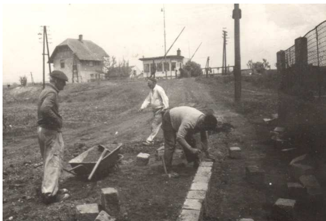
Akce „Z“ v roce 1965