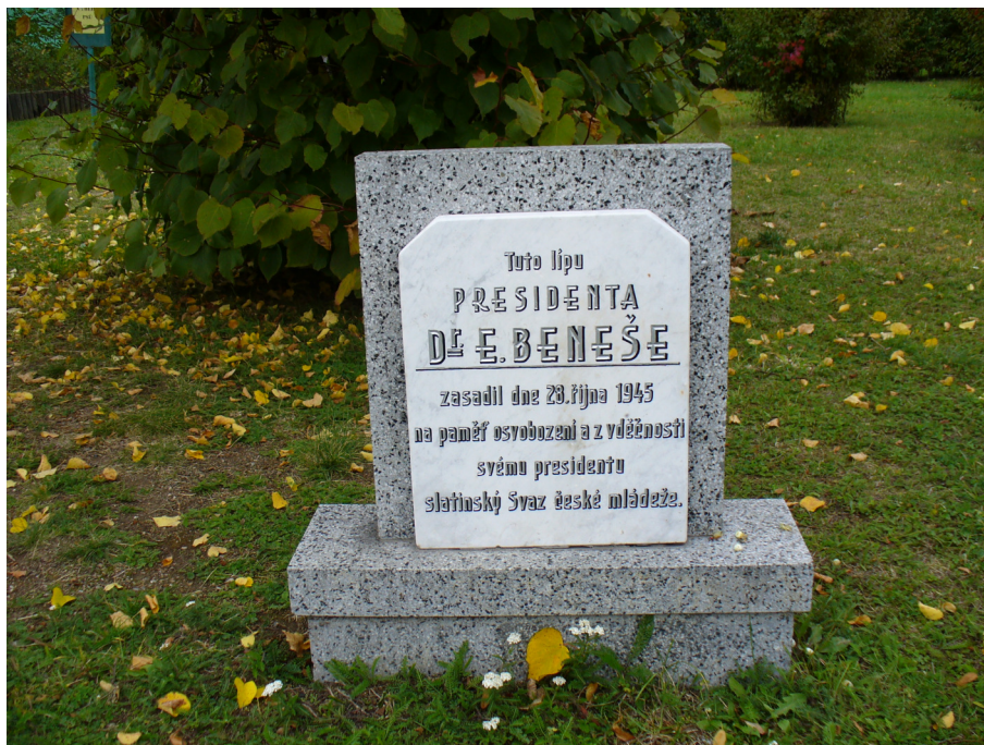
Pamětní deska na zasazení lípy v Hliníku