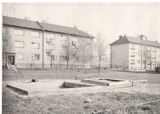
Ulice Vlnitá začátkem 70. let 20. století