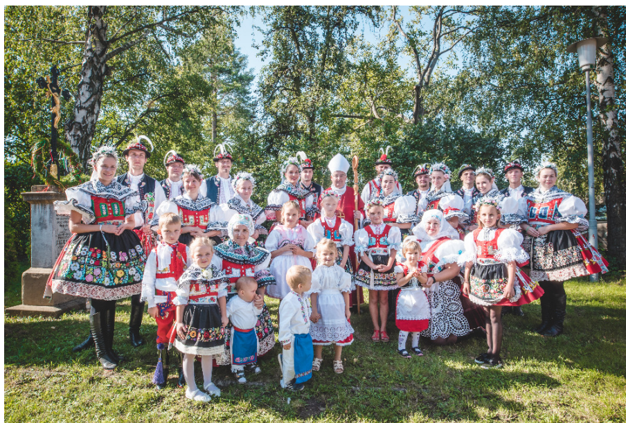
Hodovníci s panem biskupem před kostelem