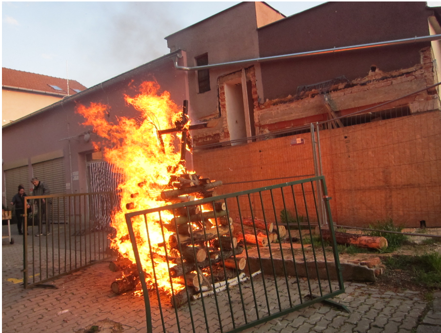
Čarodějnice je už v plamenech