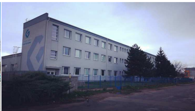
Budova školy v listopadu 2017

Budova na ulici Šmahova 110 slouží od roku 1997 jako sídlo tehdejší Integrované střední školy polygrafické v Brně (od roku 2013 Střední školy grafické Brno). Škola jako taková byla zřízena v roce 1988 odtržením od Středního odborného učiliště místního hospodářství města Brna s cílem vyučovat sazeče, tiskaře a knihaře odděleně od jiných oborů. Budova na Šmahově ulici v současné době slouží jako sídlo školy a pracoviště praktického vyučování. V menším rozsahu se zde vyučují i teoretické předměty. Na škole lze vystudovat maturitní obory Polygrafie, Obalová technika, Reprodukční grafik pro média, Tiskař na polygrafických strojích a Technik dokončovacího zpracování tiskovin. Nabízeny jsou i zkrácené formy studia s výučním listem. Mimoto škola zajišťuje další vzdělávání dospělých v rámci celoživotního vzdělávání. Ve škole se vyrábí nejrůznější polygrafické produkty, a právě Aktuality o Slatině jsou jedním z nich.