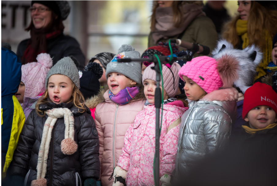
Malí zpěváčci na Vánočních trzích