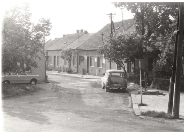
Konec ulice Budínská v roce 1979