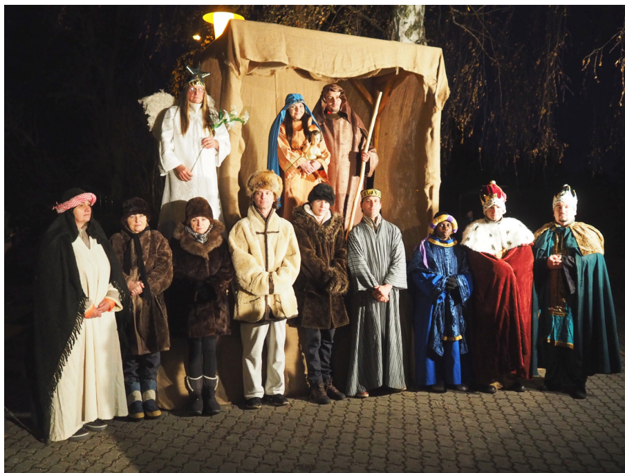
Živý Betlém ve Slatině