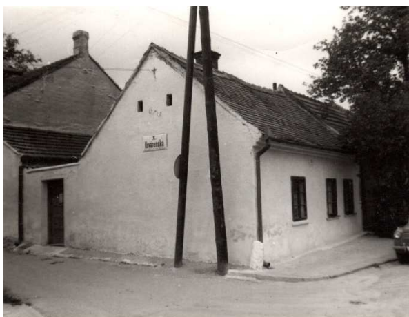
Původní domek ve 40. letech 20. století