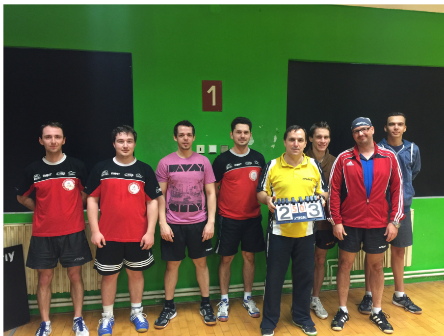
Hráči stolního tenisu