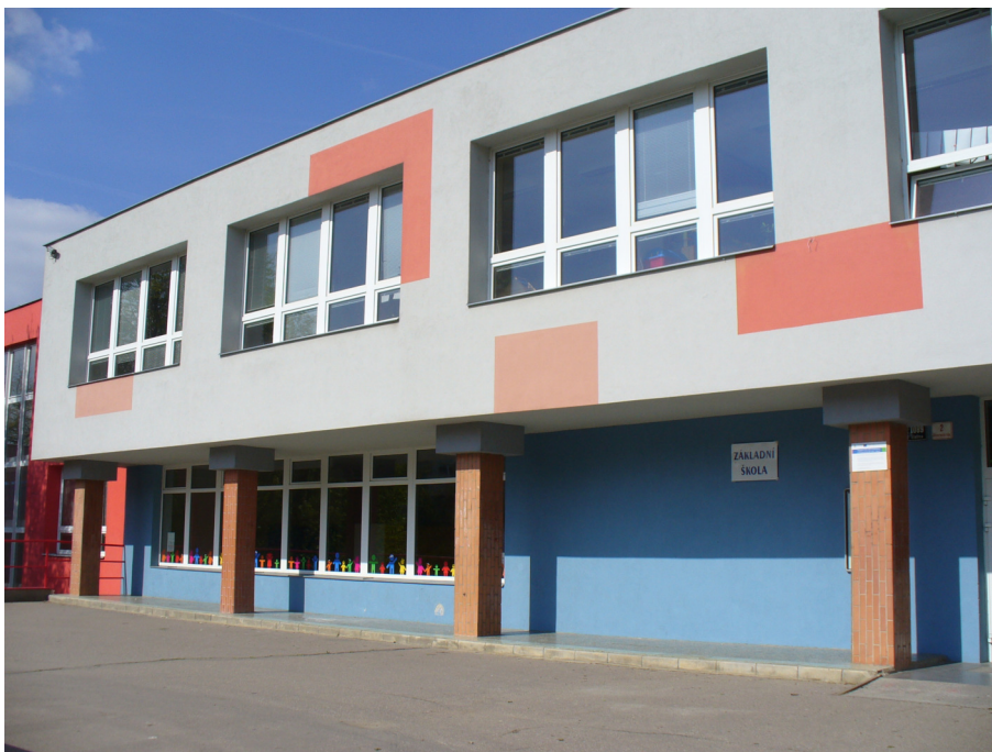
Pohled na průčelí ZŠ a MŠ na Jihomoravském náměstí