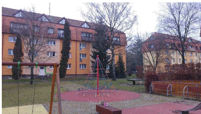
Ulice Vlnitá v roce 2018

Ulice Vlnitá vznikla v roce 1953 a byla nazvána podle své polohy v mírně zvlněném terénu. Bytové domy v této ulici byly koncem devadesátých let minulého století rozšířeny o půdní nástavby, později jednotlivé domy prošly celkovou revitalizací. Vlnitá ulice se může pyšnit rozlehlým dětským hřištěm obklopeným bohatou zelení. Dopravní zatížení této lokality je minimální.