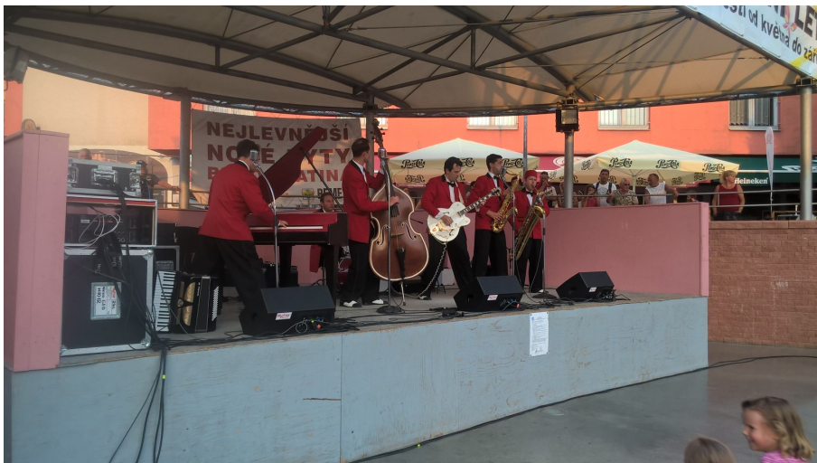
Hudební vystoupení na v rámci Slatinského kulturního léta