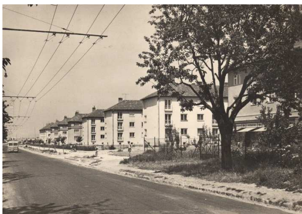
Ulice Tilhonova koncem 50. let 20. století