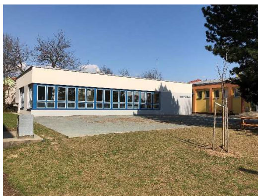
Mateřská škola na stejném místě v dubnu 2018