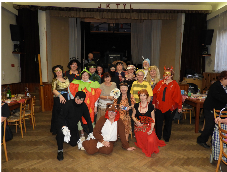
Divadelní soubor J.K.Tyl