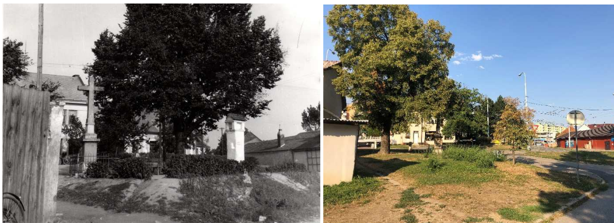
Pohled na Boží muka a Napoleonský kříž v roce 1943 Stejný pohled v roce 2018

Na rozhraní ulic Lučiny a Tilhonova stojí od konce roku 1805 čtyři metry vysoký kamenný kříž s Kristem, nazývaný jako Napoleonský kříž. Stojí v místě, kde je hromadný hrob vojáků, kteří přišli o život následkem zranění v Bitvě u Slavkova. Vedle kříže původně stála i Boží muka, jak zachycuje fotografie z roku 1943. Boží muka však byla časem zničena. Naštěstí je do dnešních dnů zachován alespoň původní kříž, který se v roce 2005 dočkal třetí opravy.