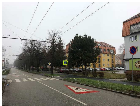
Ulice Tilhonova v roce 2018