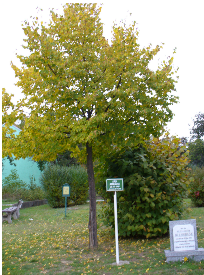
Za původní lípu z roku 1945 byla zasazena nová lípa a má se k světu