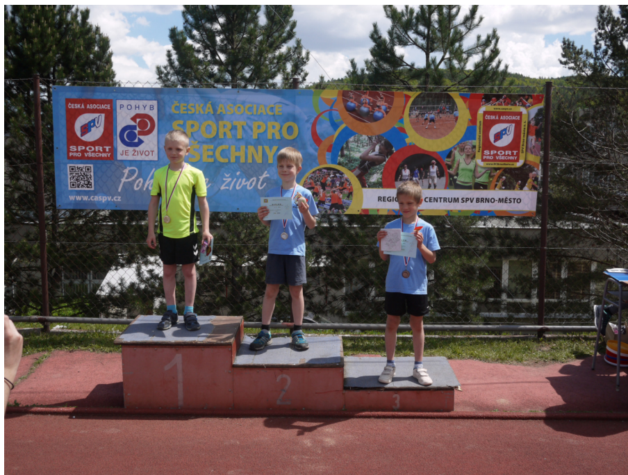
Vítězové v jednom ze závodů ČA Sportu pro všechny