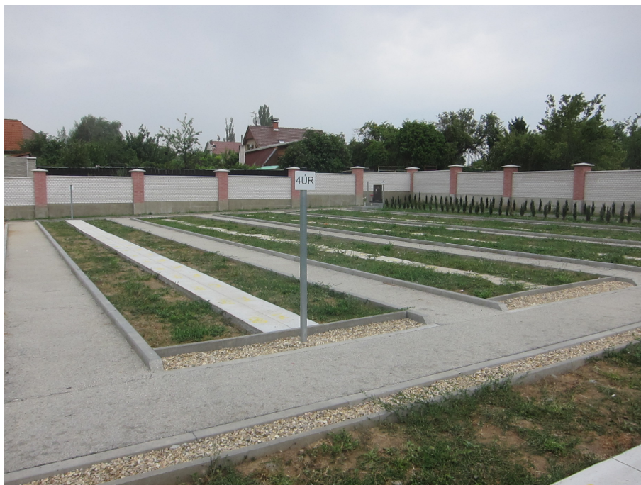
Pohled na novou vybudovanou část hřbitova