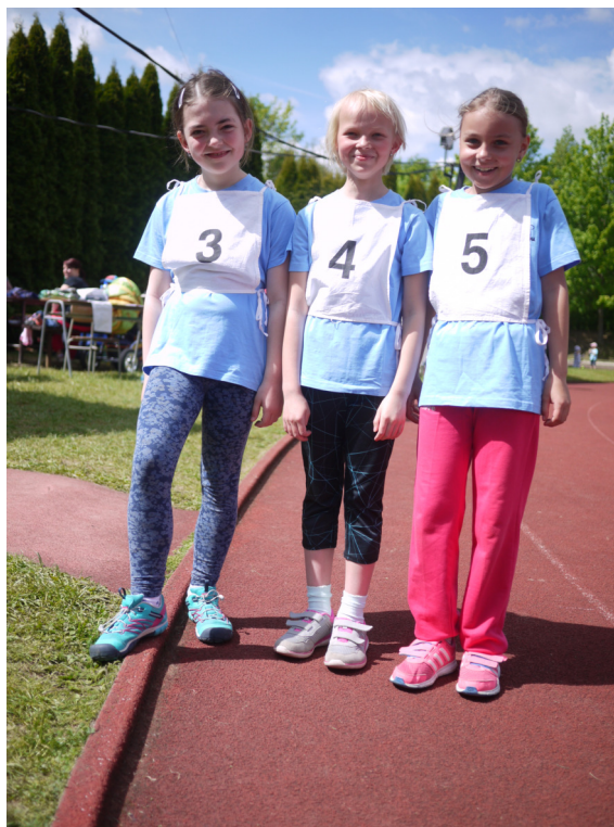
Vítězné účastnice na závodech ČASPV