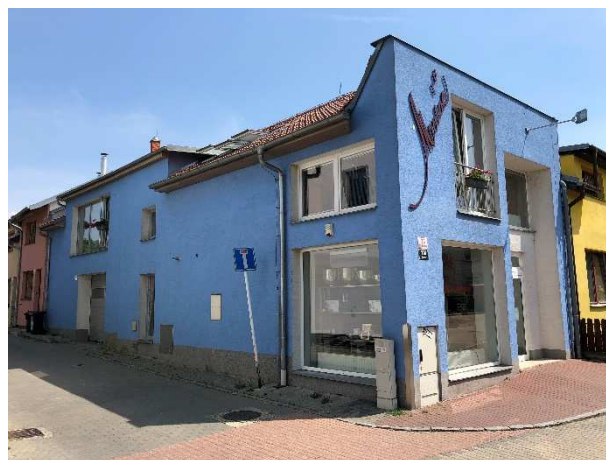
Dnes na stejném místě sídlí soukromá firma