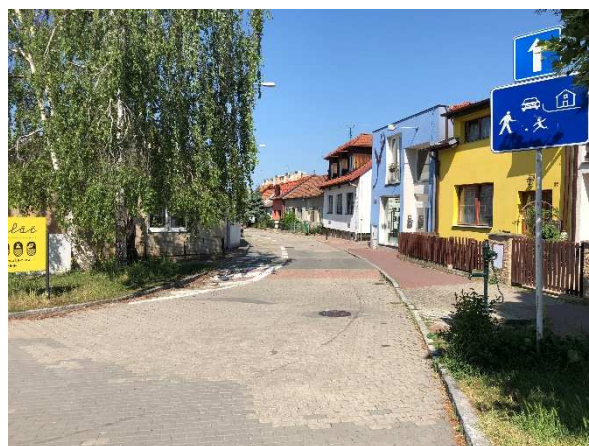
Stejný pohled v květnu 2018

Ulici Budínská jsme se věnovali v seriálu Slatina kdysi a dnes už vícekrát (Aktuality 6/2016, 11/2016, 5/2017). V tomto vydání můžeme porovnat fotografie zachycující konec ulice, kde ústí do ulice Malachova. Ulice Budínská je původně druhá nejstarší část Slatiny. Od počátku v ní stály malé rodinné domky „domkařů“, obývané bezzemky, především dělníky. Ulici se odjakživa říkalo Budín. Proč tak tomu bylo však není historicky doložené. V roce 1930 byla tato ulice i z tohoto důvodu oficiálně pojmenována Na budíně a v roce 1946 byla přejmenována na Budínská, čímž zaniklo historické pojmenování Budín. Snímek zachycuje i budovu, která