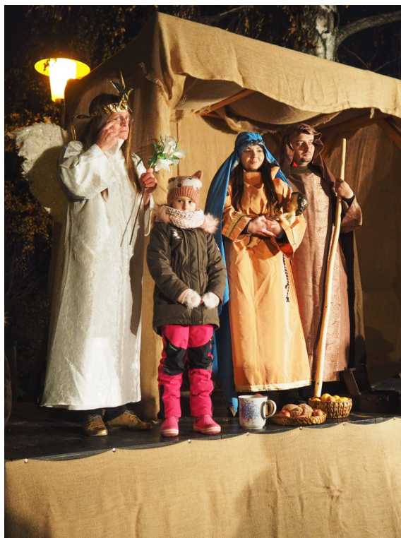
Živý Betlém ve Slatině