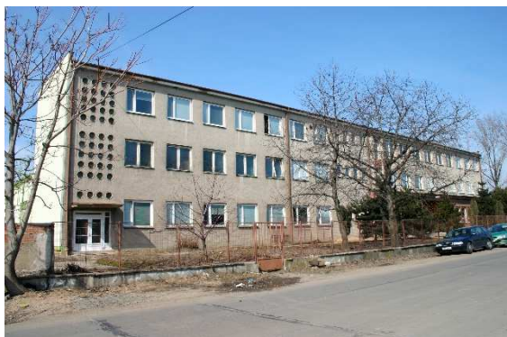
Budova školy v roce 2006