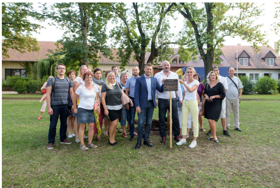
Sázení lípy k 100. výročí vzniku naší republiky