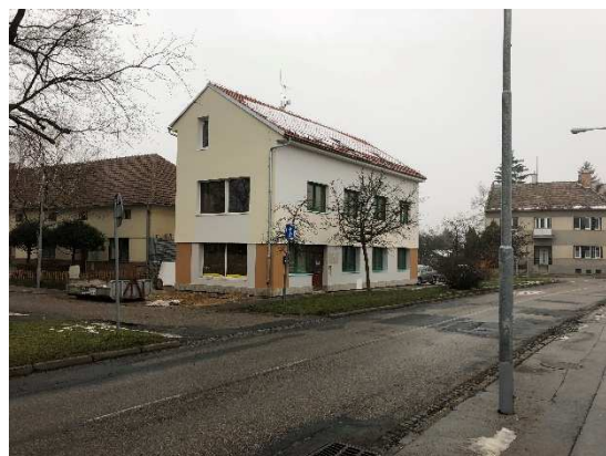
Stejný pohled začátkem roku 2018

Na Přemyslovo náměstí se v seriálu Slatina Kdysi a dnes vracíme už poněkolkáté. Historická fotografie tentokrát zachycuje, mimo jiné, dnes již neexistující tři domky, z nichž poslední sloužil jako obecní pastouška, která v roce 1852 vyhořela. Velmi rychle však byla postavena nová. Druhý a třetí domek byly zbourány kolem roku 1970 a v místech, kde domy stály, je dnes zřízeno malé parkoviště. Na místě prvního stavení, které bylo zdemolováno nedávno, dnes stojí nová budova, která bude sloužit jako asijské bistro a klub.