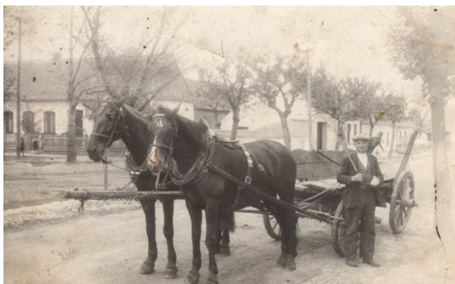
Přemyslovo náměstí v 50. letech 20. století