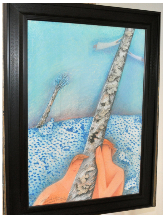
Obraz paní Plotěné na výstavě